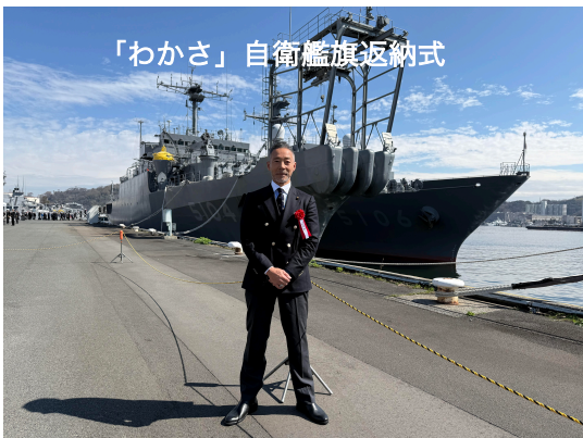
「わかさ」自衛艦旗返納式

横須賀で暮らす誇りと責任を胸に、これからも皆さんとともに安全で安心なまちづくりに取り組んでまいります。