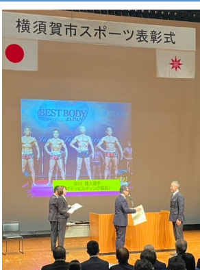
横須賀市スポーツ表彰式